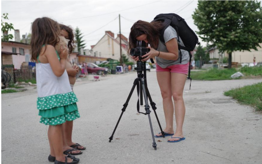
Claire Martin (Australia, 1980)

Graduada en Trabajo Social, sus proyectos fotográficos se centran principalmente en aportar visibilidad a las comunidades menos favorecidas y más ignoradas de los países desarrollados. El objeto de algunos de sus trabajos ha sido los suburbios marginados de las ciudades más ricas del mundo, las consecuencias del terremoto en Haití, la prostitución o la vida en las comunidades marginales del primer mundo.